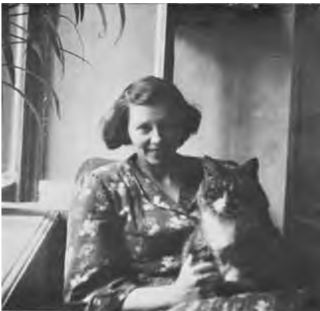
Кот, который пережил блокаду Ленинграда.