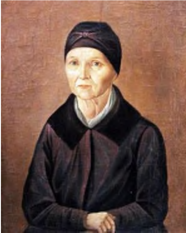
Портрет няни Пушкина Арины Родионовны

Ведущий: С детства в Саше кипели гены его африканского предка, и поэтому впоследствии сформировался его горячий характер и неординарная внешность.