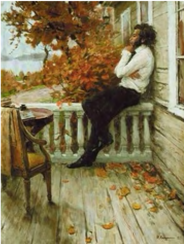
Александр Пушкин в Михайловском селе

Именно в это время Пушкин написал «Кавказского пленника», «Графа Нулина», «Бориса Годунова», и целый ряд стихов – «Наполеон», «Зимнее утро». Александр начал работу над «Евгением Онегиным» и успел написать несколько глав этой поэмы.