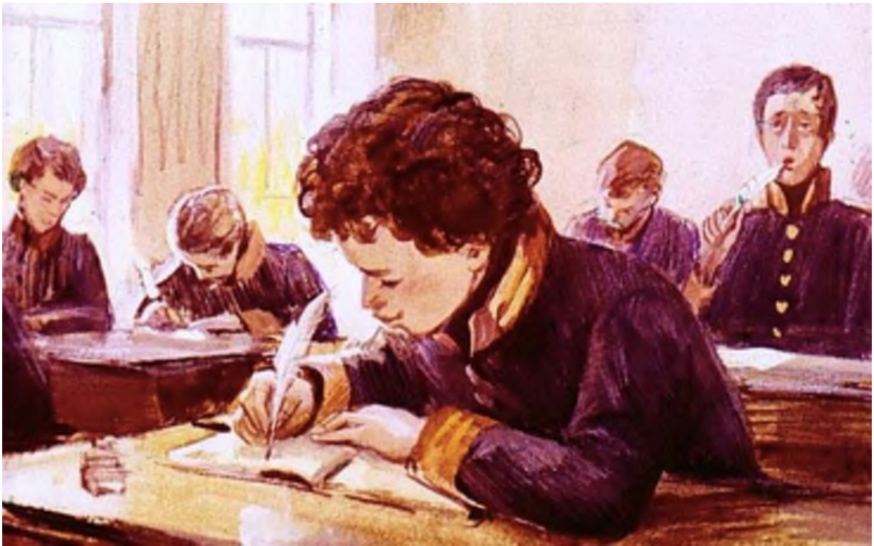
Александр Пушкин в лицее

Ведущий: В лицее использовалась абсолютно новая, можно сказать, революционная система обучения. Тридцать первых учеников-мальчиков были выходцами из дворян, для их обучения привлекли молодых, высокообразованных педагогов. Атмосфера в учебном заведении была очень свободной и дружеской, отсутствовали телесные наказания, что до этого никогда не практиковалось в школах.