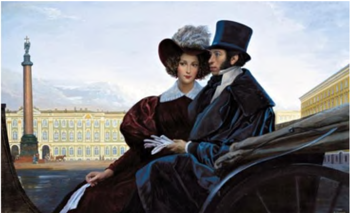
Александр Пушкин с женой Натальей

Ведущий: Александр отправился в свое будущее имение, чтобы официально оформить право на его владение. Он собирался сдать деревню в залог, и вырученные деньги потратить на приобретение приданого для Натальи. 3 сентября 1830-го он прибыл в Болдино, собирался быстро решить все дела и наконец-то жениться на своей любимой. Сам император уже благословил молодых, так что дело оставалось за малым.